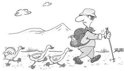
WANDERVÖGEL

Wenn die Vöglein munter singen, uns ein Wanderliedlein bringen, wenn der Frosch im Teiche quakt, Mäuslein froh am Grashalm nagt und der Specht klopft "love me tender" - dann ist Fr ü h l i n g im Kalender!